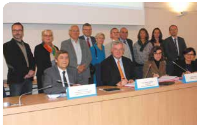
Lors de la signature du CLS à Mortagne-au-Perche.

communes qui composent le Pays du Perche ornais, soit près de 50 000 habitants. Parmi les 17 actions envisagées, on peut citer : la création d'un conseil local de santé mentale, la création d'une programmation locale coordonnée d'activités physiques adaptées pour les personnes âgées, la mise en place d'une cellule locale de veille sur l'habitat dégradé, développer les transports à la demande pour faciliter l'accès aux loisirs, développer un programme local de formations mutualisées sur les addictions, imaginer des actions de sensibilisation des jeunes aux addictions dans les établissements scolaires, construire un programme local d'éducation thérapeutique, mettre en place un dispositif local d'accompagnement pour l'installation de jeunes professionnels de santé.