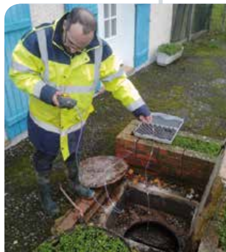
Un technicien effectue la mesure des boues dans une fosse.

METTRE SON ASSAINISSEMENT EN CONFORMITÉ EST UN INVESTISSEMENT SUR L'AVENIR QUI PERMET AU PROPRIÉTAIRE DE DONNER DE LA VALEUR À SON HABITATION AU MOMENT DE LA VENTE.