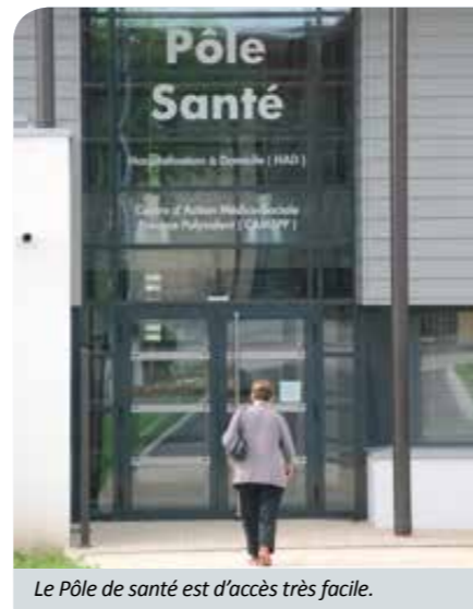
Le Pôle de santé est d'accès très facile.