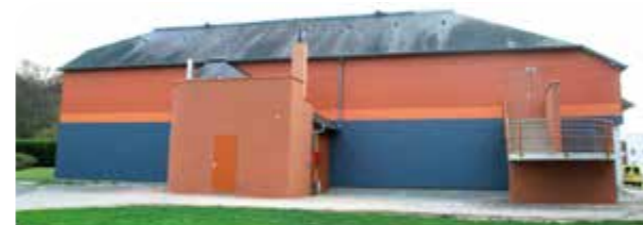
Grâce à la nouvelle isolation extérieure, des économies d'énergie vont être réalisées.

Cet équipement sportif très sollicité tout au long de l'année par le lycée Jean Monnet et les associations fait l'objet depuis l'an dernier d'un important programme de rénovation. La CdC du Bassin de Mortagne a étalé les investissements sur deux exercices budgétaires. Chaque tranche de travaux se chiffre à 400 000 € TTC. En 2015, les interventions ont concerné la couverture, l'isolation extérieure, l'amélioration du chauffage et la réfection des faux plafonds de la salle. Pour 2016, les entreprises vont travailler à la rénovation et à la mise aux normes des vestiaires, le remplacement du sol et l'amélioration de l'éclairage.