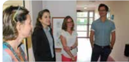
57 professionnels de santé (sur notre photo les kinés) sont répartis sur 1600 m 2 .

Le nouvel équipement* réalisé par la CdC du bassin de Mortagne-au-Perche a rapidement trouvé sa place. En à peine quelques mois, le pôle de santé conçu par le cabinet d'architectes Archi Triad a su séduire à la fois les professionnels de santé mais aussi la population. L'endroit affiche quasiment complet avec une multitude de spécialités concentrées sur le même site. Médecins, infirmiers, masseurs-kinésithérapeutes, chirurgiens, podologue, ostéopathe, diététicien, angiologue, psychologue, CAMSPP de l'Orne, le HAD, tous ont trouvé les conditions idéales pour exercer leur activité. Le pôle de santé de Mortagne-au-Perche est une réponse apportée pour lutter contre la désertification médicale dans les territoires ruraux. L'outil sera bientôt visible sur internet puisqu'un site pour la prise de rendez-vous, conçu en collaboration avec le Pays du Perche ornais, est annoncé.