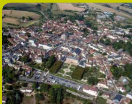
Le territoire de demain se prépare aujourd'hui.