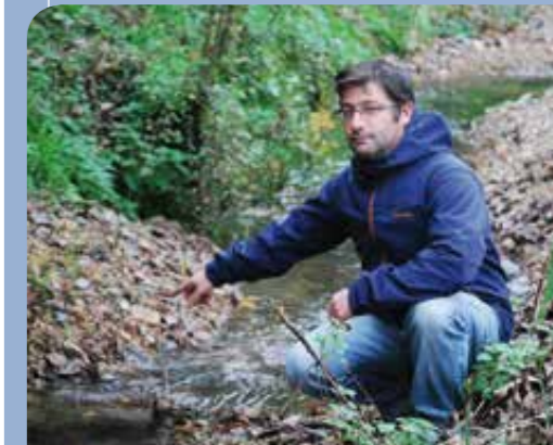
En 2015, le ruisseau de Landres à Mauves-sur-Huisne a fait l'objet d'un travail de restauration sur 2 km. L'objectif : réparer le cours d'eau et recréer un environnement favorable à la vie piscicole.

En partenariat avec le syndicat intercommunal de la Pervenche et de l'Erine, la CdC du Bassin de Mortagne-au-Perche a signé au cours de l'année 2015 un nouveau contrat territorial de restauration des cours d'eau. Durant cinq ans, jusqu'en 2019, un programme de travaux de 700 000 € va être mené sur le bassin de la Pervenche et de l'Erine ainsi que celui de l'Hoëne. Ces interventions sont subventionnées à hauteur de 80% grâce au soutien de l'Agence de l'eau Loire Bretagne, la région Basse-Normandie, le Conseil départemental de l'Orne et la Fédération ornaise de pêche. Le reste à charge pour la CdC se monte à 20%. Un premier gros projet verra le jour cette année à Mauves-sur-Huisne avec le rétablissement de la continuité écologique au niveau des rivières de contournement. Il est à noter que des opérations spécifiques porteront aussi sur l'aménagement des cours d'eau.