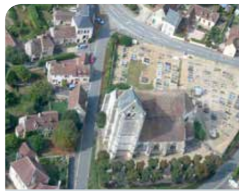
Le droit des sols génère chaque année environ 3000 demandes à l'échelle du Perche ornais.

D epuis le 1 er juillet 2015, l'instruction des autorisations d'urbanisme (permis de construire, d'aménager, de démolir, certificat d'urbanisme, déclaration préalable, etc.) n'est plus assurée par les services de l'État. Cette mission a été confiée à un service mutualisé d'instruction créé au sein du Pays du Perche ornais. Deux instructeurs à mi-temps ont été recrutés pour le faire fonctionner. Les communes de Mortagne-au-Perche, Bazoches-sur-Hoëne, Saint-Hilaire-le-Châtel, Sainte-Céronne-lès-Mortagne, La Chapelle-Montligeon et Saint-Langis-lès-Mortagne disposant d'un document d'urbanisme ont été les premières à adhérer à ce service. Dans la pratique, les mairies jouent le rôle de guichet unique en réceptionnant les demandes. Elles les transmettent ensuite au Pays pour instruction. Après approbation du PLUi, ce pôle de compétences répondra aux demandes provenant des 33 communes composant la CdC du Bassin de Mortagne-au-Perche. Contact : 02 33 85 80 80. Pays du Perche ornais, ancien Palais de justice, 8, rue du Tribunal, Mortagne-au-Perche.