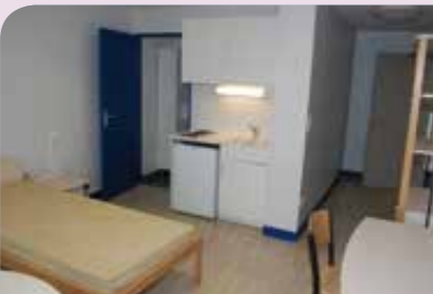
Tous les logements sont meublés et équipés.

Contact : 02 33 15 20 30 - Résidence Habitat Jeunes du Perche, route d'Alençon 61400 St-Langis-Lès-Mortagne.