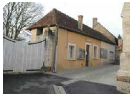
La mairie est nichée dans l'une des ruelles du bourg.