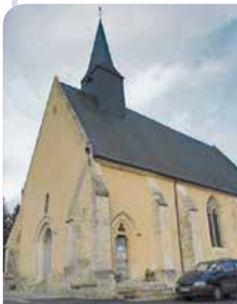
L'église Saint-Rémi a une position dominante sur la butte féodale.